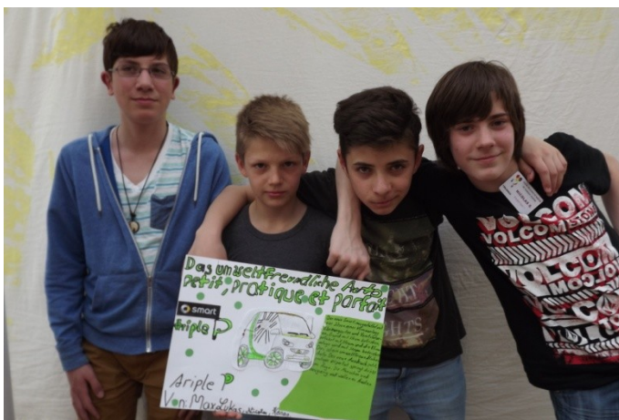
Vier Freunde müsst ihr sein! Da hat die Annäherung aber schnell geklappt.