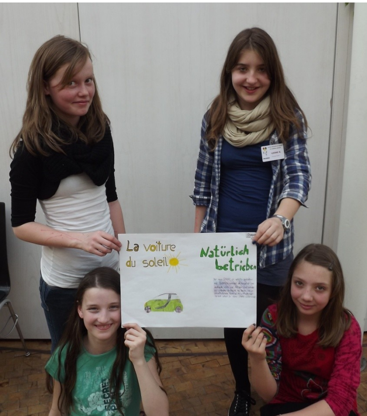
Die Gruppe setzt noch eins drauf: „Gut, très-bien, Smart!“