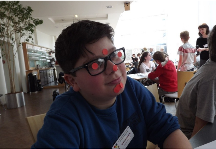
Ein bisschen Spaß muss sein!