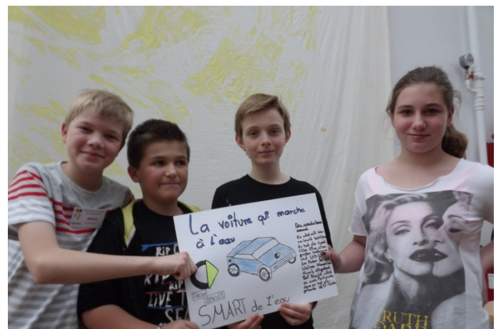
Hier sind die Ingenieure am Werk! La voiture qui marche à l'eau.