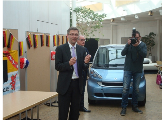
Oberster Besuch. Der Smart Chef und Gastgeber persönlich.