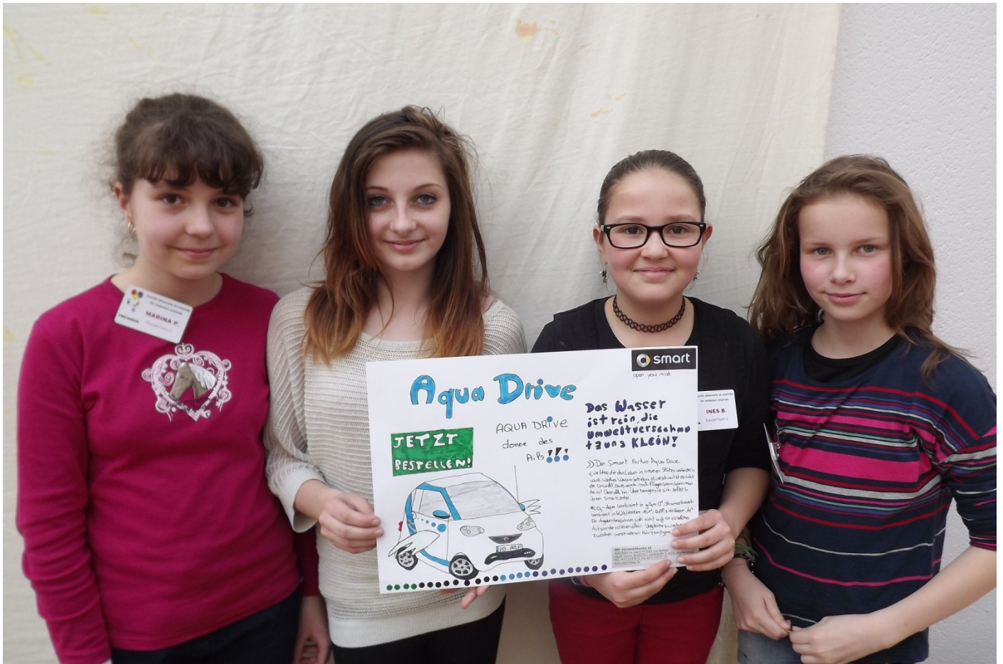
Hops! Was ist denn das? Ein englischer Ausreißer. Egal, Europa ohne Grenzen.