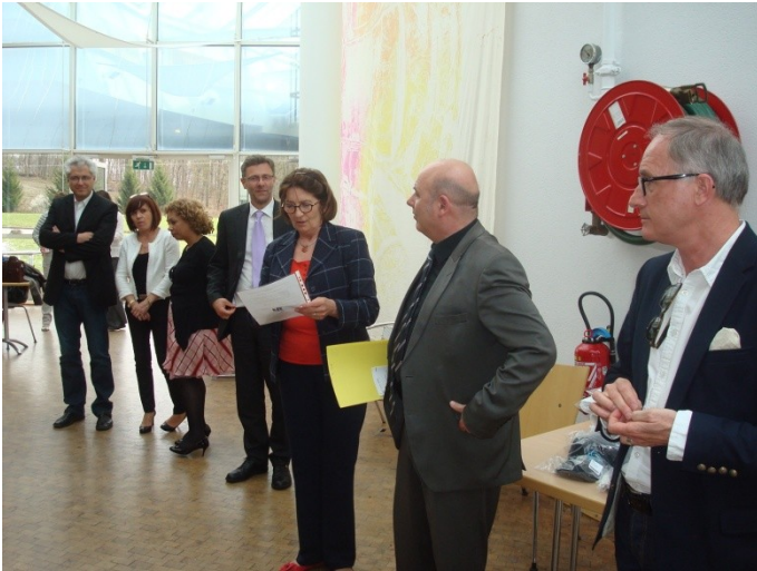
Die Spannung steigt nach einer langen Stunde.