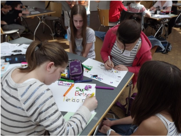
„Super, besser, Pedalosmart“ Die Gruppe brütet über dem Werbespruch.