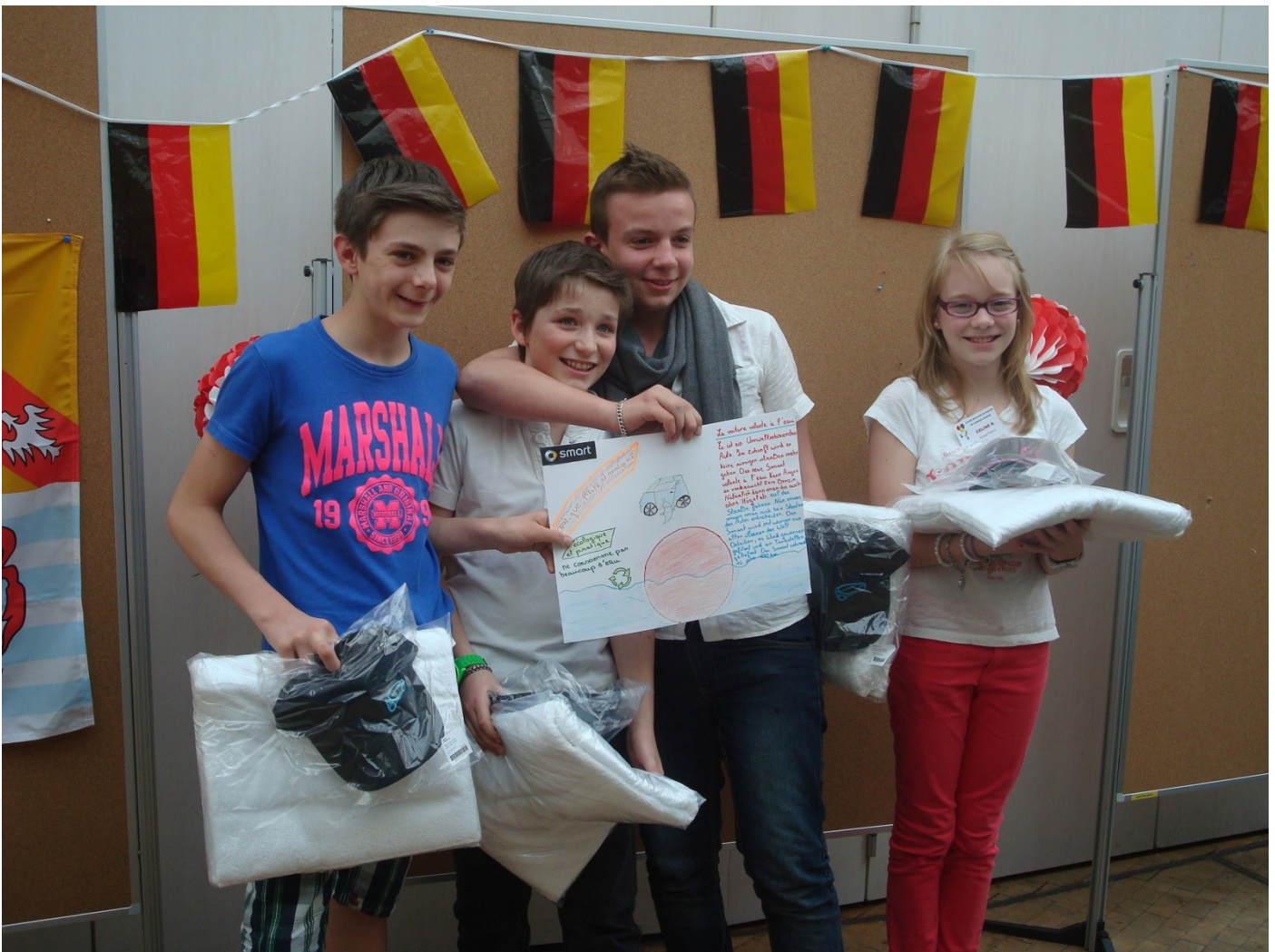
Die Sieger. Gewonnen hat nicht nur der Entwurf, sondern die Idee dahinter: Das Auto mit Meerwasserbetankung.