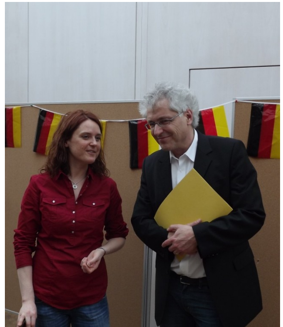
Gewusst wie. Muss denn jetzt gerade der blöde Fotograf kommen. Keiner sollte doch merken, dass wir hier abpausen, um ein schönes Exemplar hinzubekommen.